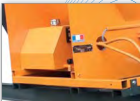
Ensemble hydraulique réservoir et distributeur