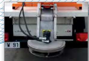
Ensemble arrière de projection en inox