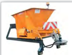
Berce classe 1