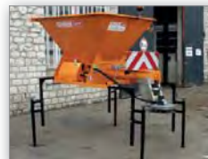
Béquilles à manivelles